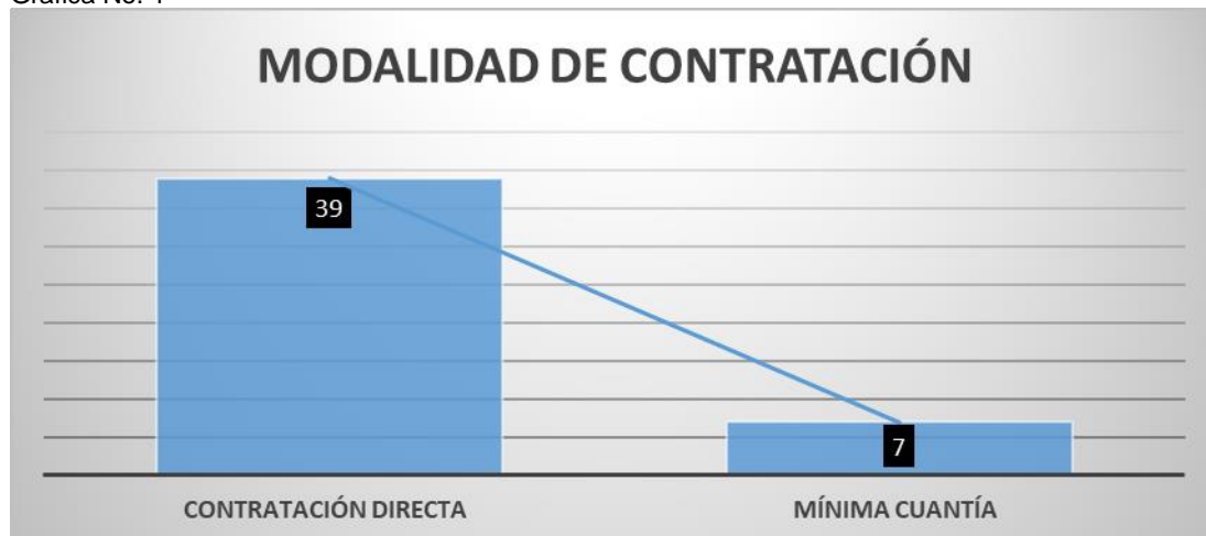
Grafica No. 1