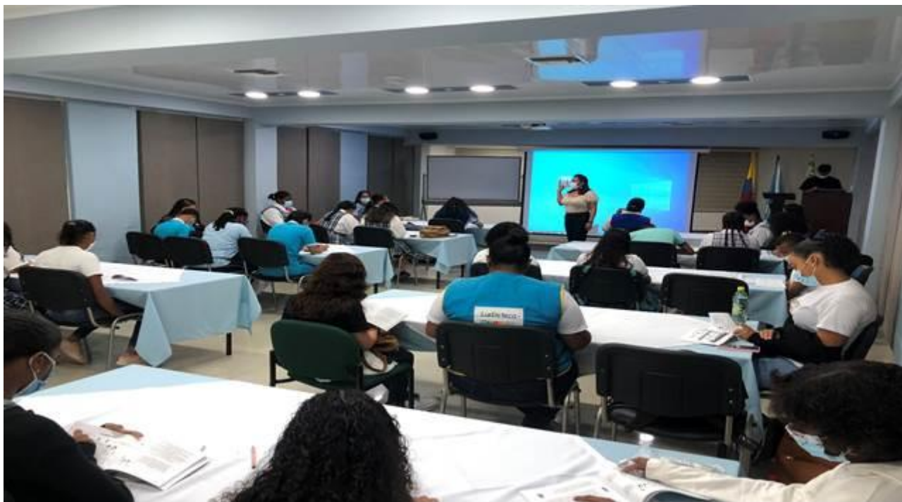
Capacitación en Control Fiscal y Control Social, a docentes de los centros de desarrollo infantil, realizada el día 26 de octubre de 2021, en el Centro Zonal ICBF Magic Room