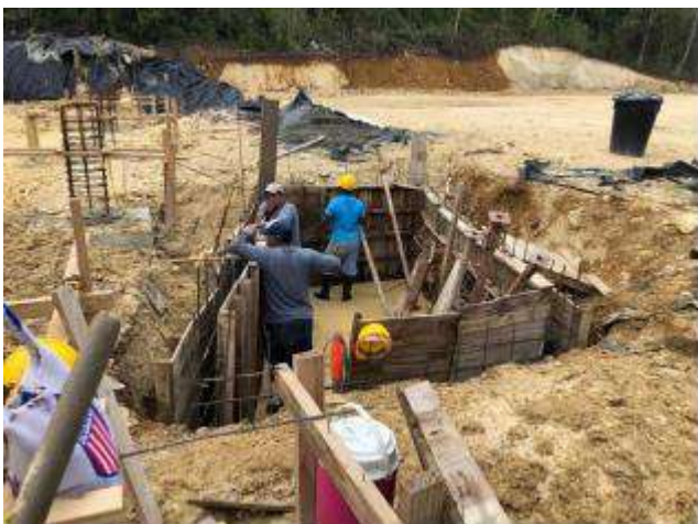
Registro costado occidental

La interventoría por su parte, ejecutada por EEDAS , realiza visitas periódicas (3 veces por semana) al lugar y realiza comité de obra junto con el contratista y el equipo de ingenieros encargados de cada una de las actividades en obra, los días viernes en las horas de la mañana. A continuación, se anexa registro fotográfico de los avances de las obras.