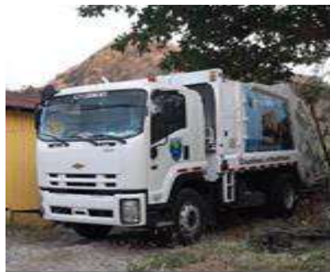
Ilustración 4. Camión Recolector RamonErre

Marca: RAMONERRE / MODELO: R-1 2000 CAPACIDAD DE CUERPO: 17 yardas cubicas CAPACIDAD DE TOLVA: 2,5 yd3 MATERIAL DE LA CAJA: ACERO