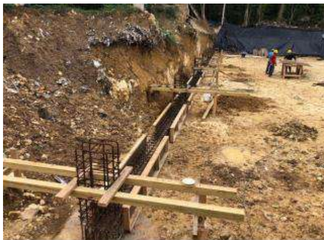
Viga amarre costado norte (Bodega CDR)