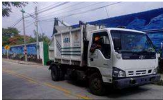
Ilustración 3. Camión Recolector Buffalo

Marca: Buffalo Longitud de caja 3700mm Altura total de caja: 1800mm Ancho total de caja: 2200mm Capacidad de volumen: 9y3 Accionamiento hidráulico: Manual por medio de 2 palancas