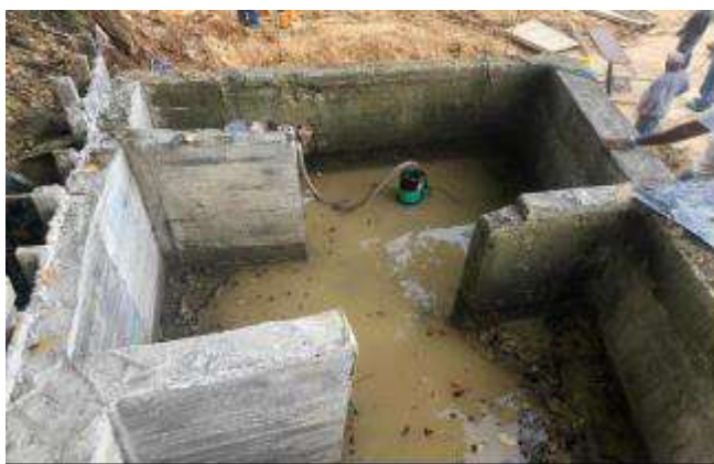
Dissipador de energía

Lo descrito con anterioridad, evidencia que el Departamento a través de la secretaría de Servicios Públicos y Medio Ambiente, ha ejecutado las gestiones administrativas, técnicas y ambientales tendientes a velar por el cumplimiento de todas las obligaciones contraídas por el operador del servicio de aseo en su componente de disposición final, las cuales representan importantes avances para lograr el cumplimiento de la Sentencia de referencia, así mismo, es menester indicar que esta Administración continúa realizando las acciones pertinentes para darle una solución definitiva a la acumulación de residuos y lograr un