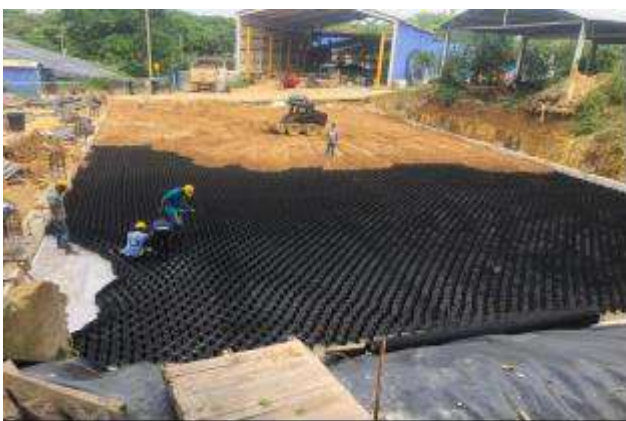
Instalación piso industrial (bodega CDR)