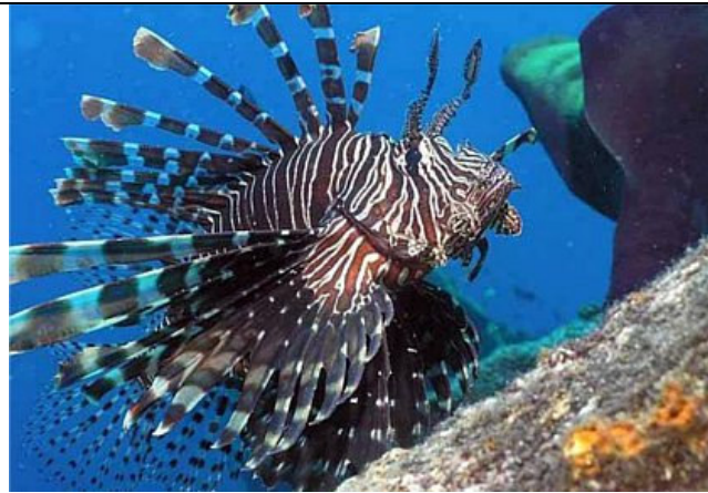
Pez león

Por Agencia de Noticias de la Universidad Nacional